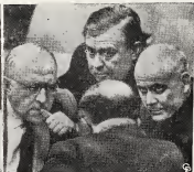
E último siman tabata un yen di conferencia y deliberacion pa evita un desastre mundial. Ribá e prome grafica president Kennedy y Adlai Stevenson, embahador di EE. UU. cerca Naciones Unidas. Ribá e di dos Valeriy Zorin conferenciando cu e otro miembros di e delegacion Sovietica.